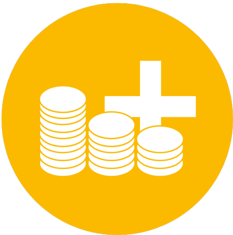
Mehr als nur Lohn